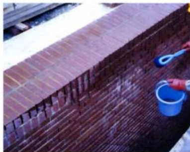
<施工前>タイル目地からの白華